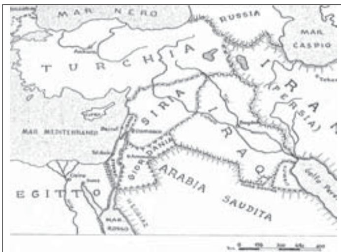
LA SITUAZIONE ATTUALE DEL MEDIOORIENTE

Il metodo che usava Paolo per far conoscere il Cristianesimo fuori dell'ambiente palestinese era il seguente (cfr. Atti 13,14-52; 14,1-7; 17,1-13; 18,19-21; 19,24-28 ):