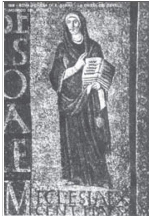
Particolari del mosaico della chiesa di S. Sabina (sec. V - Roma): Le due matrone rappresentano la chiesa ebraica e la chiesa "gentile"